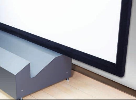
Nur 75 cm Bautiefe